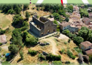
Site Saint Pons