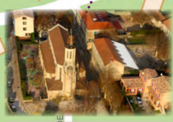
Notre Dame des Victoires