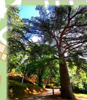
Parc Saint Roch